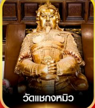
วัดเขงทมิ้ว