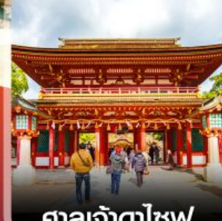
ศาลเจ้าตาไซฟุ