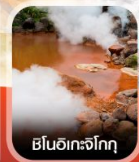
บ่อนอิเกะจิกุกุ

✈️ คอนเฟิร์ม ออกเดินทาง ✈️ ทุกพีเรียด 2 ท่านขึ้นไป