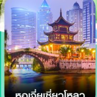
หอเจียเซี่ยวไหลว