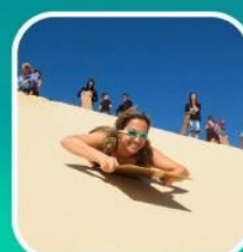
เล่นกระดานทรายจากยอดเนินทรายสูงชัน