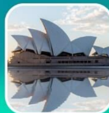
ซิดนีย์, โอเปร่าเฮาส์