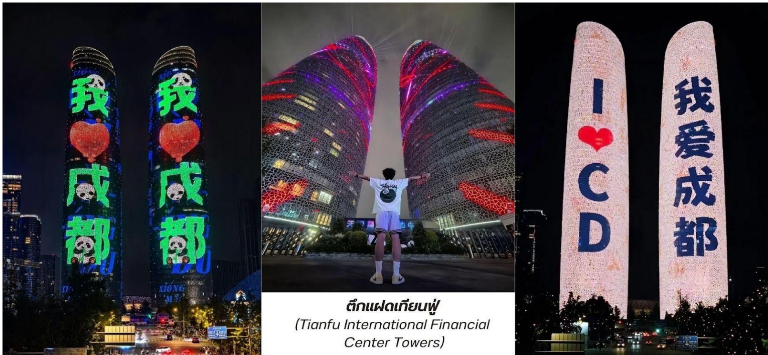
ตึกแฝดเทียนฟู่ (Tianfu International Financial Center Towers)

สมควรแก่เวลา นำท่านเดินทางกลับสู่โรงแรมที่พัก ระหว่างทางนำท่านแวะชมแสงสีต่ายรูปด้านนอก ตึกแฝดเทียนฟู่ (Tianfu International Financial Center Towers, 天府双塔) สัญลักษณ์แห่งความทันสมัยและความก้าวหน้าของเมืองเจียงตู ตึกระฟ้าแฝดแห่งนี้ตั้งตระหง่านอยู่ใจกลางย่านการเงินแห่งใหม่ ตึกแฝดเทียนฟู่มีความสูงกว่า 220 เมตร แต่ละตึกมีดีไซน์ที่โฉบเฉี่ยวและเป็นเอกลักษณ์ โดยเฉพาะในยามค่ำคืน ตัวอาคารจะถูกประดับประดาด้วยไฟ LED ที่สว่างไสว ทำให้เกิดการแสดงผลแสงสีที่สวยงามตระการตา