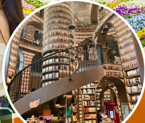
จงซูเก๋อ