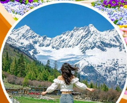
ภูเขาสี่ดรุณี ช่วงเลียวโกว (รวมรถอุทยาน)

สวนสวรรค์แห่งดอกไม้ MANHUA- จงซูเก๋อ-จัตุรัสหย่างเทียนวู่-รูปปั้นแพนด้าเซลฟี เมืองโบราณกวนเซียน-อุทยานเขาสี่ดรุณี(รวมรถอุทยาน)-สะพานหนานเจียว เมืองลั่วไต้-ตึกแฝด-SKP-วัดต้าจื่อ-ถนนคนเดินซุนซีลู่-IFS-ตงเจียวจี้จี้-ถนนคนเดินไท่กุหลี่