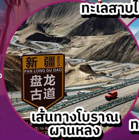
เส้นทางโบราณ ผานหลง