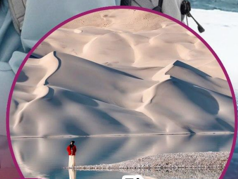
ทะเลสาบไปซาหุ