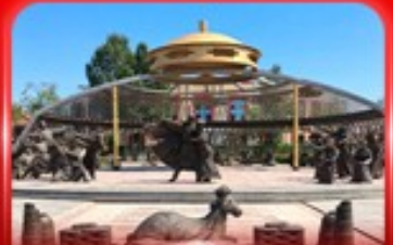
สวนวัฒนธรรมการแต่งพานวอร์ดอส