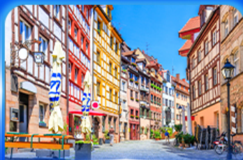
ย่านเมืองเก่า บูเรมเบิร์ก