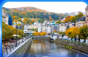
เมืองแห่งสา คาร์โลวารี