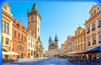
ย่านจัตุรัสปราก