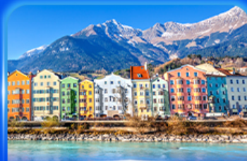
อาคารสีลูกกวาด อินส์บรุค