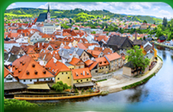
เมืองมรดกโลก เซสที่ครุมลอฟ