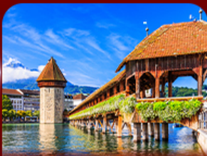
สะพานไม้ชาเปล ลูซิริน