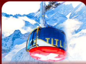
*Optional* นั่งกระเช้าชมวิวทิวทัศน์