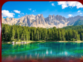
ชมวิวโดโลไมท์ ทะเลสาบคาเรชชา