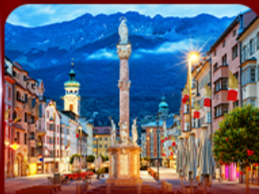
เที่ยวย่านเมืองเก่า อินส์บรุค