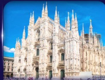
เข็ควินวิหารดูโอโม มิลาโน