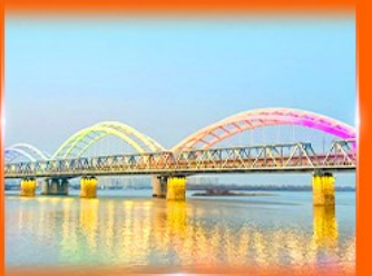
สะพานรถไฟผืนโจว