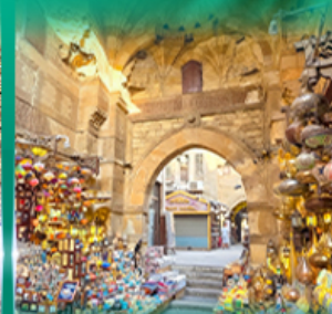
ตลาดผ่านเวลกาลี่