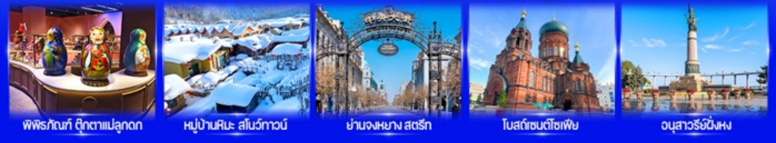
พิพิธภัณฑ์ ตุ๊กตาเป็ดลูก