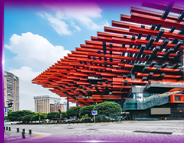
แลนด์มาร์กฉิ่ง ตึกตะเกียบ