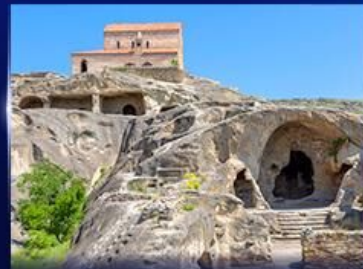
เมืองถ้ำโบราณ อุพลิสซิค