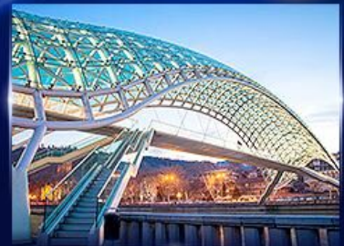
สะพานแห่งสันติภาพ ทบิลีซี