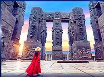
อุทยานประวัติศาสตร์จอร์เจีย