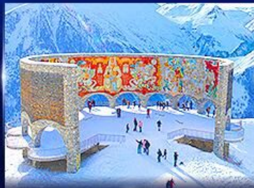
อนุสาวรีย์มิตรภาพ รัสเซีย-จอร์เจีย