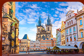
ชมย่านเมืองเก่า ปราท