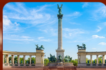
จัตุรัสวีรบุรุษ บูดาเปสต์