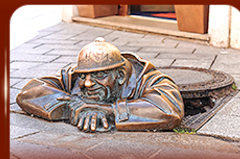
แลนด์มาร์คดัง รูปปั้นคูนิล ปรากติสลาวา