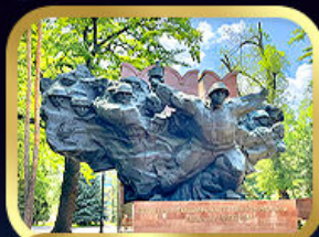
Panfilov Guardsmen Park