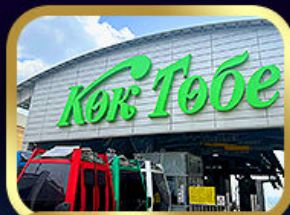
เซ็นทรัลโกทอบเชอวอลมาตี

นั่งกระเช้าชิมบุลัก • ทะเลสาบโคลไซ • ชารินเกรนด์แคเนยอน