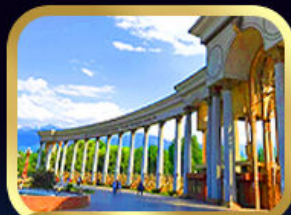
1st President Park