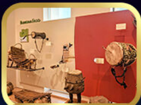
Museum of Folk Instrument