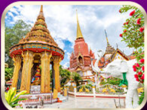
หอพระหลวงปู่ทวด วัดช้างให้