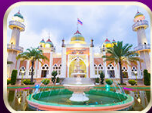
ชมมัสยิดกลางปัตตานี