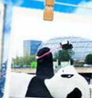
แพนด้าเซลฟี่