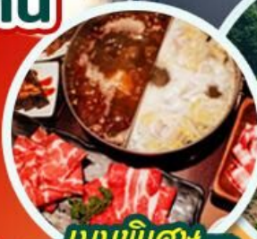
เมนูพิเศษ ชาบูหม่าล่า