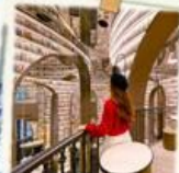
ร้านหนังสือ