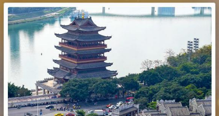
ถนนสามสายสองตอรอก