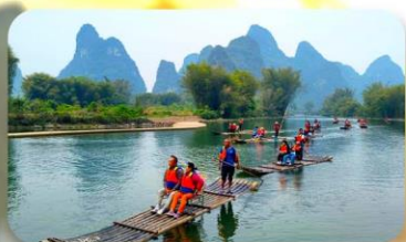
ล่องแพไม้ไผ่หยู่หลง