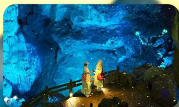
ถ้ำหลุย้อ