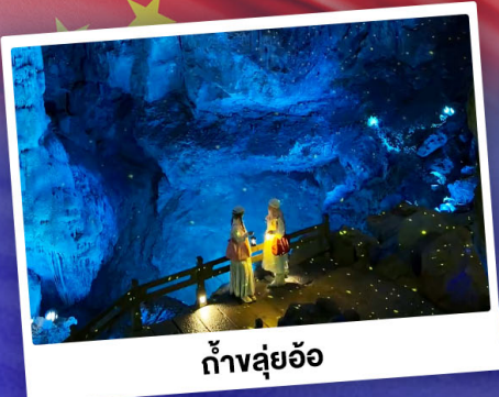
ถ้ำหลุย้อ

"ดินแดนแห่งสาขน้ำและภูเขา" สัมผัสประสบการณ์นั่งบอลลูนชมวิวมุมสูง