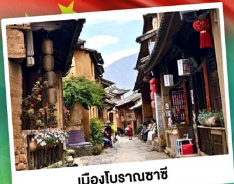
เมืองโบราณชาซี

เที่ยวสวรรค์บนดิน ภาพวาดที่มีชีวิต "เซ็กอินดาเฟี้ยวสุดอลัง"