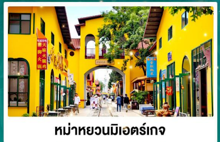
หมู่บ้านมิตอร์เกจ