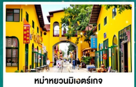
หมู่บ้านมืองค์เจียง