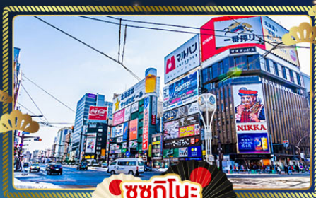
ซูซุกิโนะ