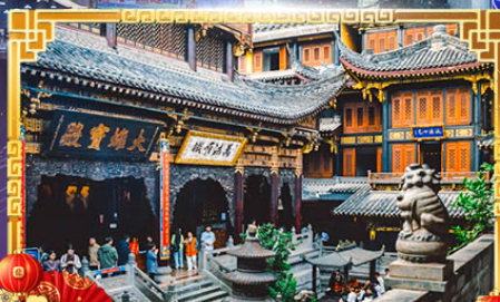
วัดหลิวหนาน