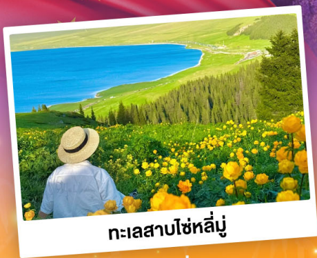
ทะเลสาบโซห์ลี่มู่