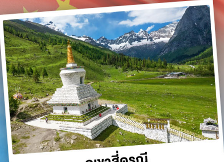
กู๋เจาสีครุณี

เที่ยว 2 อุทยาน กู๋เจาสีครุณี & ปี้ฝิงโกว เดินชมหมีแพนด้าสุดน่ารัก ใกล้ชิดกับแพนด้าแดง