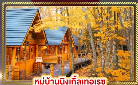
หมู่บ้านนิงเกิ้ลทอเรซ