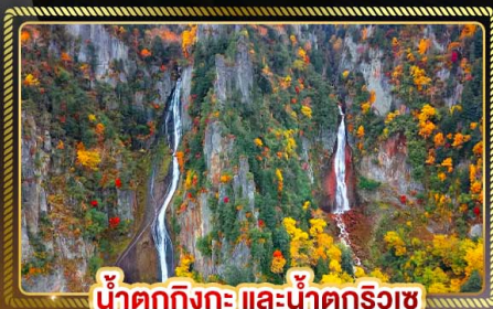
น้ำตกทิงกะ และน้ำตกริวเซ