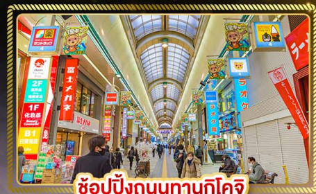
ช้อปปิ้งถนนทานุกิโคจิ