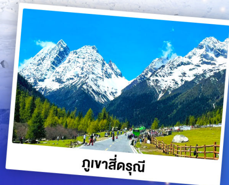
กุเวาสีดรุณี