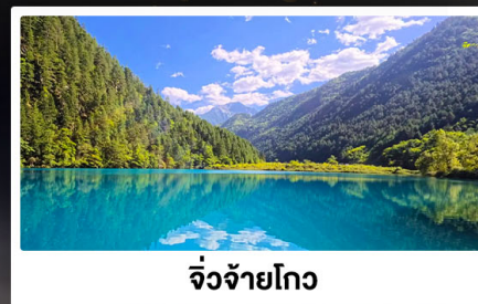
จิ้งจ้ายโกว