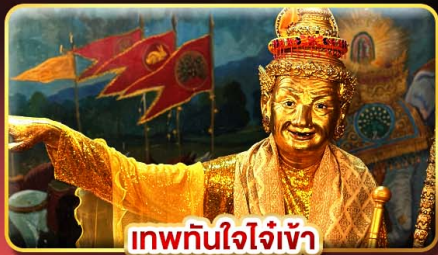
เทพทันใจใจเจ้า

สักการะพระสุพรรณกัลยา ขอพรเทพทันใจ 5 องค์ที่ศักดิ์สิทธิ์ที่สุด