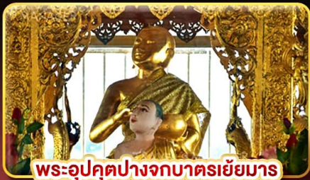
พระอุปคุตปางจกบาตรเขี้ยว