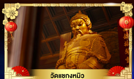
วัดแซงทมิว