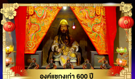
องค์แซงเก่า 600 ปี