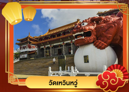
วัดเหวินหู