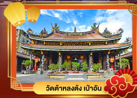
วัดต้าหลงตั้ง เป้าอัน