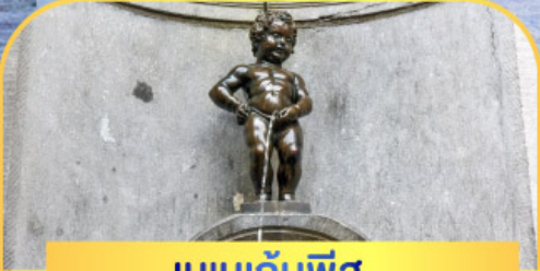
แมนกันพีส