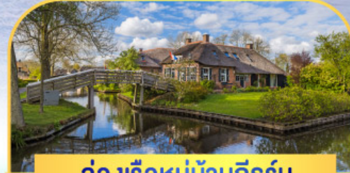
ล่องเรือหมู่บ้านทีรูร์น

HighLight • เที่ยวบรูคส์ เมืองมรดกโลก • เข้าชมพิพิธภัณฑ์ลูฟท์ • ชมเมืองเก่าลักเซมเบิร์ก 75,900 เริ่มต้น