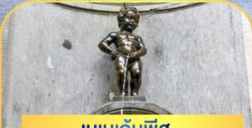
เมนกันฟิส