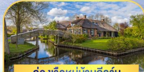
ล่องเรือหมู่บ้านทีรูรัน