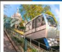
ขึ้นรถรางสู่มงมาร์ต