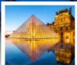
ถ่ายรูปพีไฟร์กันที่ลูฟร์