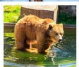
บ่อหมีเมืองเบิร์น