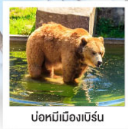
บ่อหมีเมืองเบิร์น