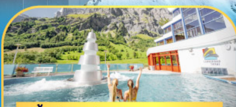
แช่น้ำแร่ร้อนผ่อนคลายลวยคอร์บิต