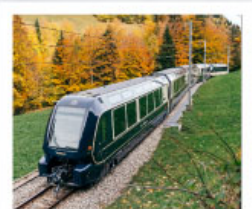
รถไฟโกลเด้นพาส