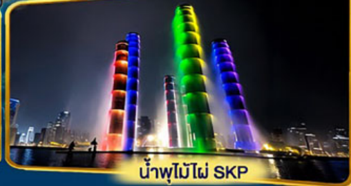
น้ำพุไม้ไผ่ SKP