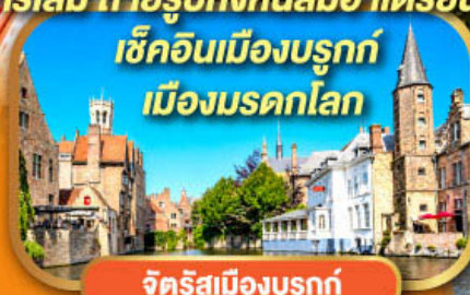
จัตุรัสเมืองบรูกซ์