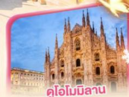
คูโอโมมิลาน