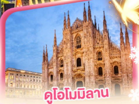
ดูโอโมมิลาน