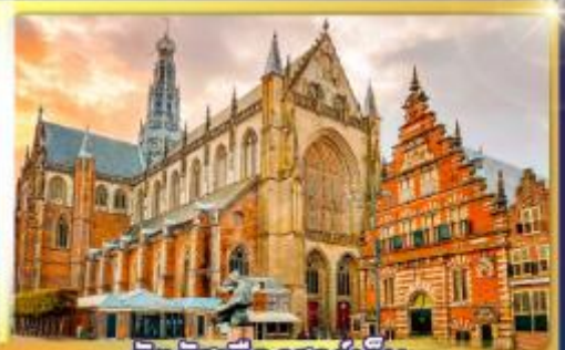
จัตุรัสเมืองฮาร์ลิม

ชมแคนเมืองแปลกเนเธอร์แลนด์และเบลเยียม เดินเมืองเคลฟท์ เมืองเครื่องปั้นดินเผาระดับโลก ฮาร์ลิมเมืองมั่งคั่งที่สุดของเนเธอร์แลนด์