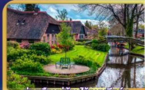
ล่องเรือหมู่บ้านไรทบนทีธูร์น