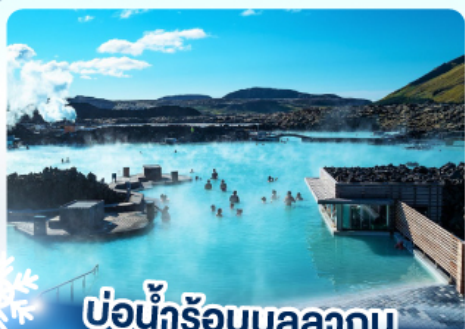
♨️ แช่น้ำร้อนบลูลากูน

เก็บไอซ์แลนด์ เดนมาร์ก ไฟน์ริสท์ทิวเฟล และ แช่น้ำร้อนบลูลากูน