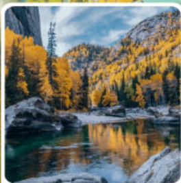
เคนเคอทัวให้อัจฉรัยภูพาน