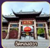
วัดหลงอว้า