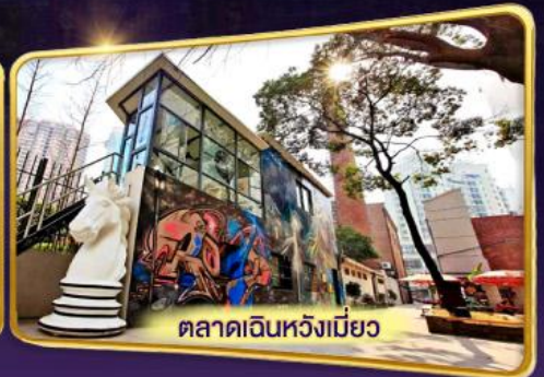
ตลาดเดินหวังเมี่ยว