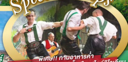
พิเศษ!! ทานอาหารค่ำ พร้อมชมการแสดงดนตรีพื้นเมืองสไตล์โรเลียน และเยือนเมืองอูเทรคต์ สีสันใหม่เนเธอร์แลนด์

ไฮไลท์ในโปรแกรม • เยือนเมืองแห่งแคว้นบาวาเรีย และ ทิโรล • สุกสนานเหมืองเกลือเบิร์ชเทสกาเดิน • เข้าชมปราสาทนอยชวานสไตน์ • เดินเล่นจัตุรัสโรเมอร์ ซอปปิง Zeil Street • ถ่ายรูปมุมสวยของหมู่บ้านอัลสติก • ซิลลา ไปในเมืองซาลสบูร์ก บ้านเกิดโมสาร์ท 25 ก.ย. - 04 ต.ค. 69 • ล่องเรือหมู่บ้านทีธูร์น และ ล่องเรือชมนครอัมสเตอร์ดัม 09-18, 16-25 ต.ค. 69 • ซอปปิงจุ้ย่านดิมสแควร์และเดินเล่นย่านโคมแดง 22-31 ต.ค. 69 / 06-15 พ.ย. 69 29 ธ.ค. 69 - 07 ม.ค. 70 * ปีใหม่ *