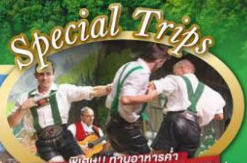
พิเศษ!! ท่านอาหารค่ำ พร้อมชมการแสดงดนตรีพื้นเมืองสไตล์โรเธีย และเขื่อนเมืองอูเทรคต์ สีสันใหม่เนเธอร์แลนด์