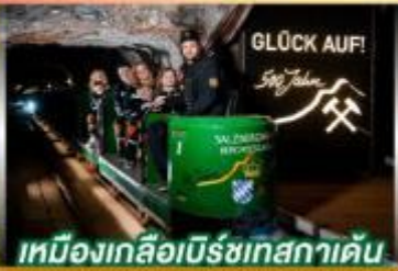
เหมืองเกลือเบียร์ชเทสกาเดิน