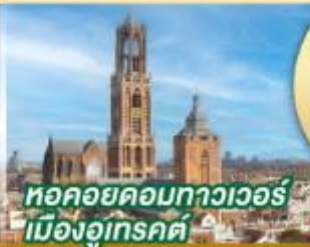
หอคอยคอกทาวเวอร์ เมืองอูเทรคต์