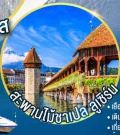
สะพานไม้ชาเปล ลูเซิร์น