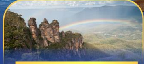
อุทยานแห่งชาติลูมาท์เก็นส์ Three Sister Rock