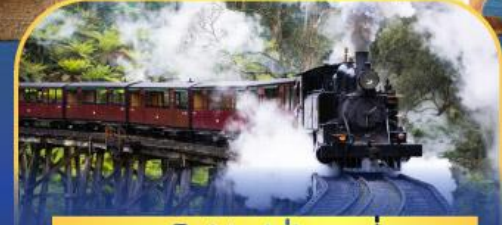
รถไฟฟู่ฟิงบิลลี่

ล่องเรือชมอ่าวซิดนีย์พร้อมรับประทานอาหารกลางวัน และ เข้าชมสวนสัตว์การองก้า