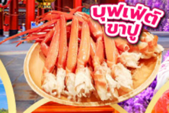
บุฟเฟ่ต์ ซาซู