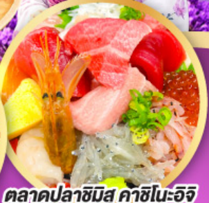
ตลาดปลาซิมิสุ คาชิโนะอิชิ