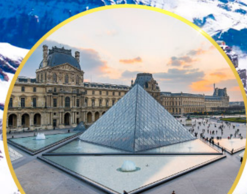
ถ่ายรูปคู่พีพีร์กันที่ลูฟร์