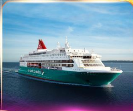
เรือสำราญ GO NORDIC CRUISE LINE