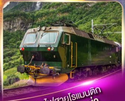
รถไฟสายโรเมนติก ฟลินส์บาน่า