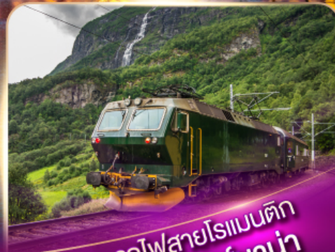
รถไฟสายโรเมนติก ฟลัมส์บาน่า