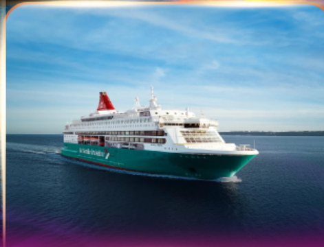
เรือสำราญ GO NORDIC CRUISE LINE